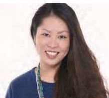
ゴスペルクワイヤ 「Viva&Y's Choir」

【開催日】ゴスペルクワイヤ5月16日(土) カントリーミュージック5月30日(土) 【公演時間】18:00~19:00 【開催場所】ノーザンテラスダイナー トウキョウ 1Fカフェ&テラス席 【参加料金】ミュージックチャージ無料/ドリンク有料